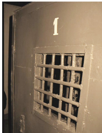
Дверь в колонии