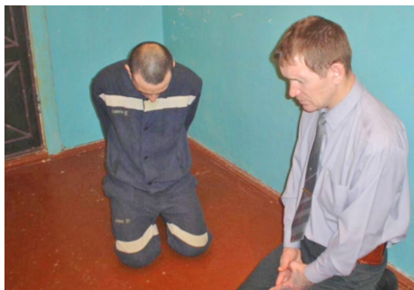
Молитва в колонии

В тот же миг я очнулся в своей конуре И упал вниз лицом на колени. Так впервые – в далеком сейчас декабре Я молился без всяких сомнений: «Боже мой!!! Боже мой!!! Знаешь Ты обо всём! И грехи все мои знаешь тоже! Ты прости, что я был, как безумный осёл, На всю голову был «отморожен»! Умоляю, прости, что не верил в Тебя И что маму родную не слушал, Что любил и лелеял всегда лишь себя И законы Твои все нарушил! Ты прости и помилуй, Господь и Творец! Сам себе я противен и мерзок. На Тебя уповаю, мой Бог и Отец, Не вмени прошлой жизни отрезок... Ты возьми меня в руку Свою, о Господь, И очисти от зла мою душу, Помоги мне в себе распознать, побороть Всю греховность, что губит и рушит... Умоляю, прости, и остаток всех дней, Что отмеришь Ты мне в этой жизни,